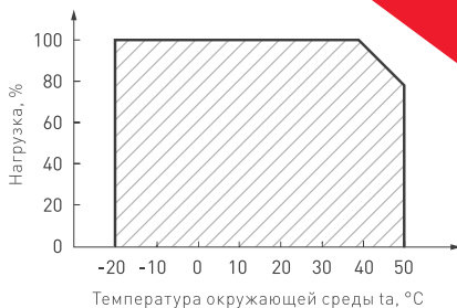
Рис. 2. Максимальная допустимая нагрузка, % от мощности источника.