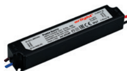
ARPV-LV12012 ARPV-LV24012 ARPV-LV12018 ARPV-LV24018