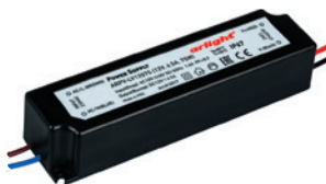
ARPV-LV12060 ARPV-LV12075 ARPV-LV24060 ARPV-LV24075 ARPV-LV24100