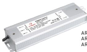
ARPV-12250-B ARPV-24250-B ARPV-12275-B