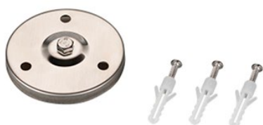
Рисунок 2. Основание для установки на поверхность (арт. 024890).