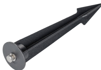
Рисунок 3. Основание для установки в грунт (арт. 024889).