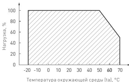
Рис. 2. Максимальная допустимая нагрузка, % от мощности источника.