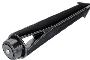
Рисунок 2. Основание для установки в грунт (арт. 024888).